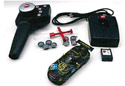
Produktfoto / Product photo / Photo du produit

Sieper GmbH Schlittenbacher Str. 60 58511 Lüdenscheid