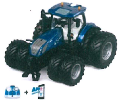
Produktfoto / Product photo / Photo du produit

Sieper GmbH Schlittenbacher Str. 60 58511 Lüdenscheid