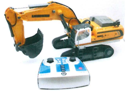
Produktfoto / Product photo / Photo du produit

Sieper GmbH Schlittenbacher Str. 60 58511 Lüdenscheid