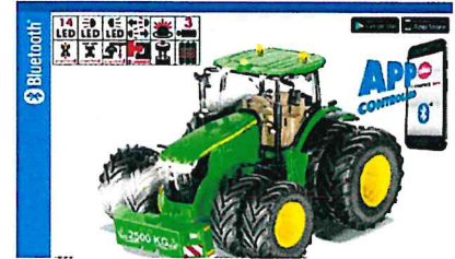
Produktfoto / Product photo / Photo du produit

Sieper GmbH Schlittenbacher Str. 60 58511 Lüdenscheid