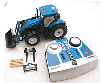
Produktfoto / Product photo / Photo du produit

Sieper GmbH Schlittenbacher Str. 60 58511 Lüdenscheid