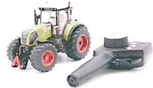
Produktfoto / Product photo / Photo du produit

Sieper GmbH Schlittenbacher Str. 60 58511 Lüdenscheid