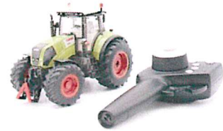
Produktfoto / Product photo / Photo du produit

Sieper GmbH Schlittenbacher Str. 60 58511 Lüdenscheid