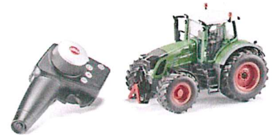
Produktfoto / Product photo / Photo du produit

Sieper GmbH Schlittenbacher Str. 60 58511 Lüdenscheid