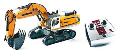
Produktfoto / Product photo / Photo du produit

Sieper GmbH Schlittenbacher Str. 60 58511 Lüdenscheid